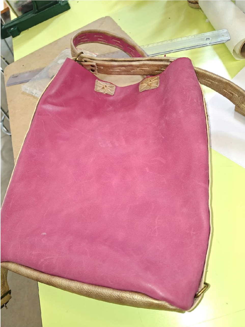
Nahkapajassa tehtiin käsin upeita laukkuja ja kenkiä.