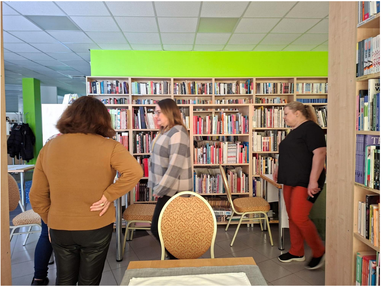
Tähän oppimisympäristöön oli yhdistetty kirjasto ja ravintola.