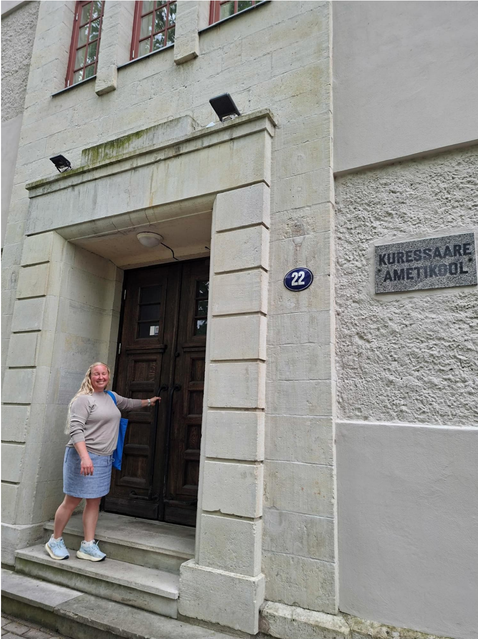
Kuressaare Ametikoolissa oltiin todella vieraanvaraisia ja ystävällisiä.