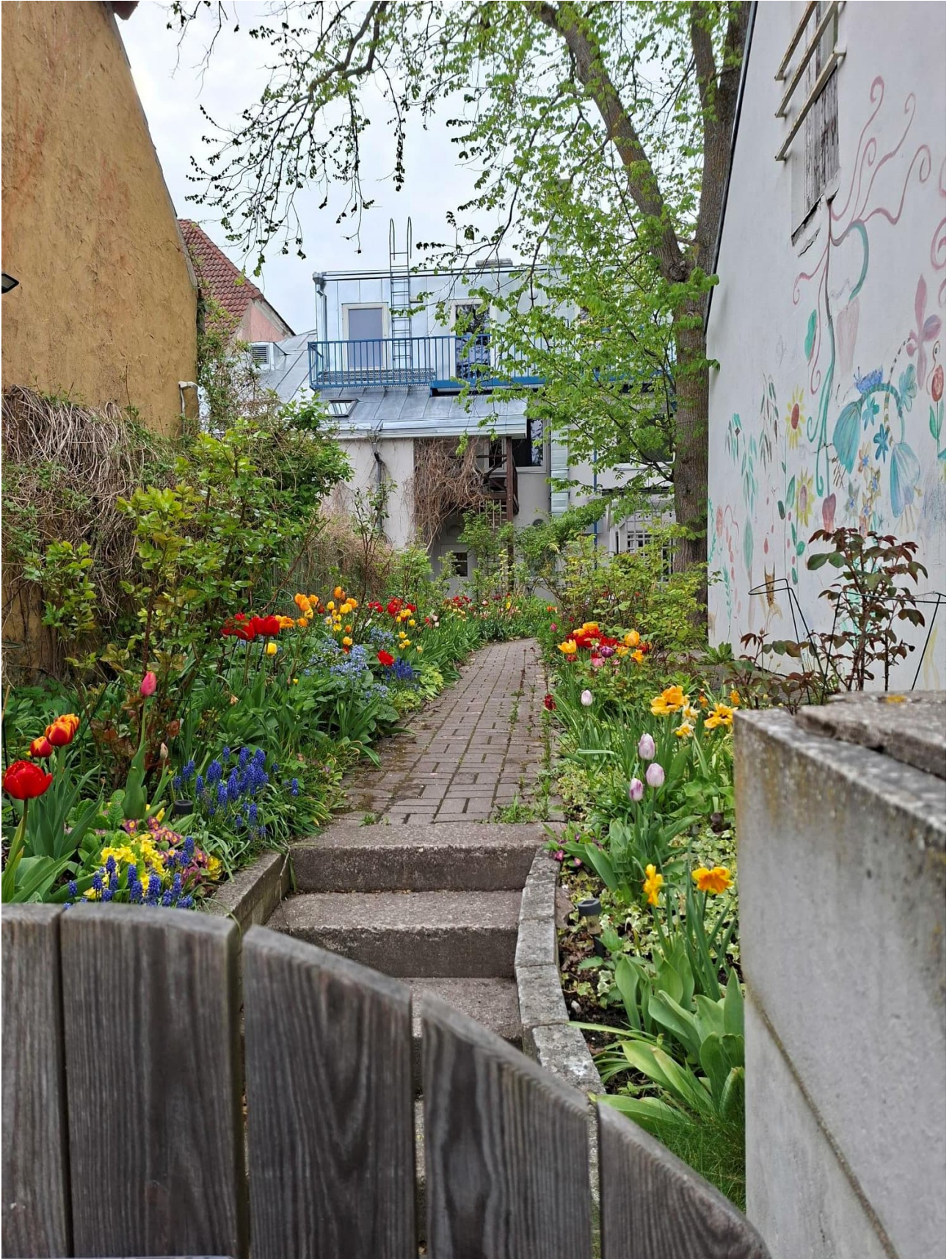
Oli onnistunut aika vieraillla Kuussaassa. Puutarhat olivat juuri puhjenneet kukkaan.