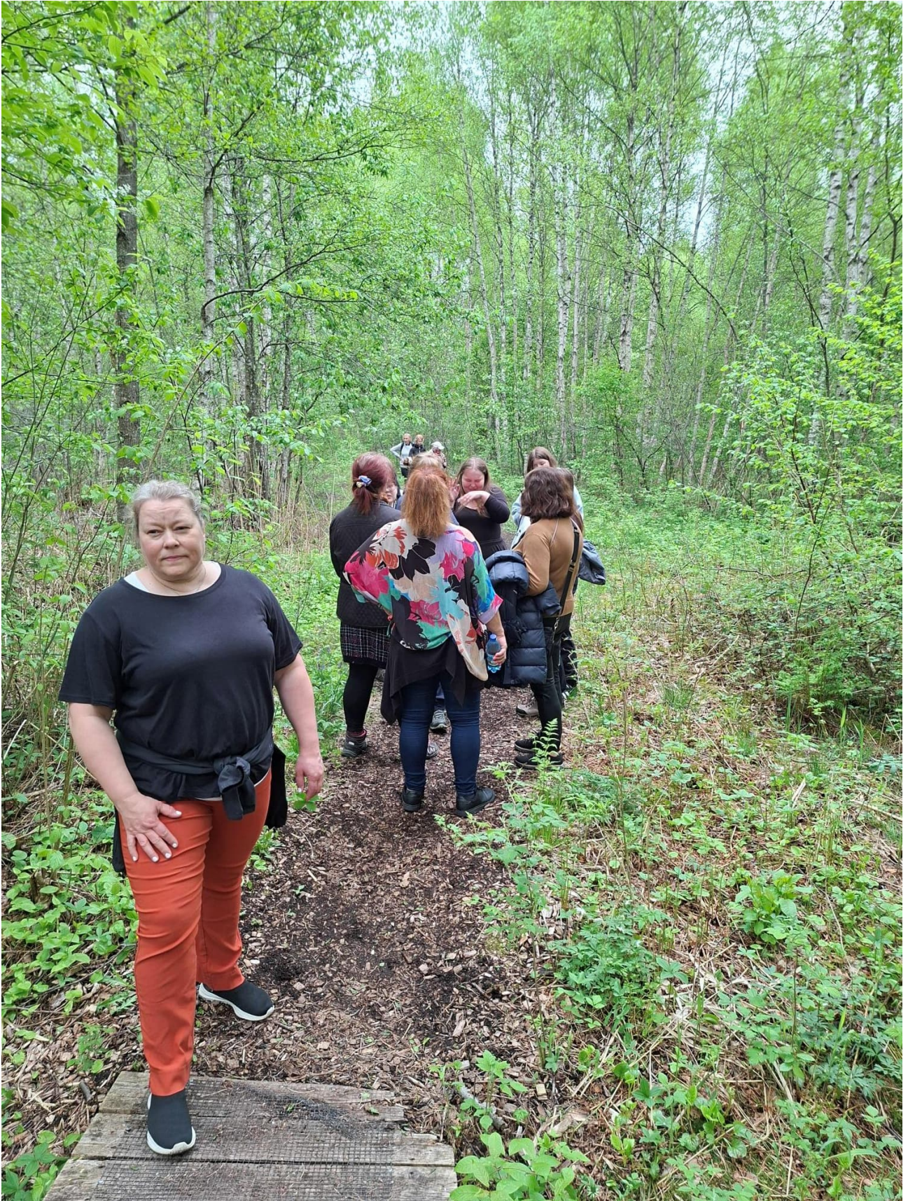
Ulkonaoppimista ja patikointia.