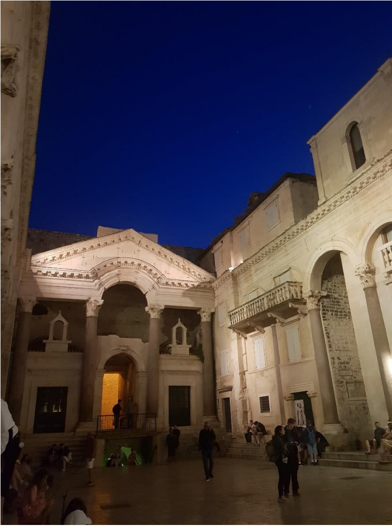
Kuva 3: Kulttuuria ja tunnelmaa 1700 vuotta sitten rakennetussa Diocletianin palatsissa, jossa nykyään on sulassa sovussa museot ja ihmisten asunnot.