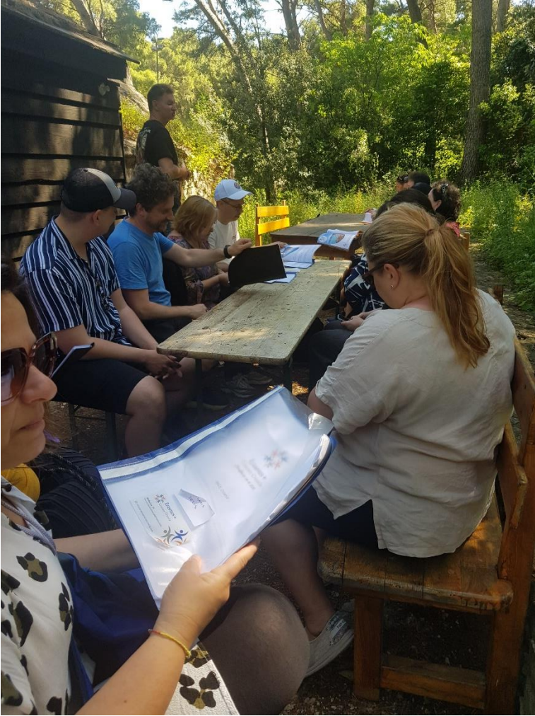
Kuva 2: Viisi aistia tehtävä