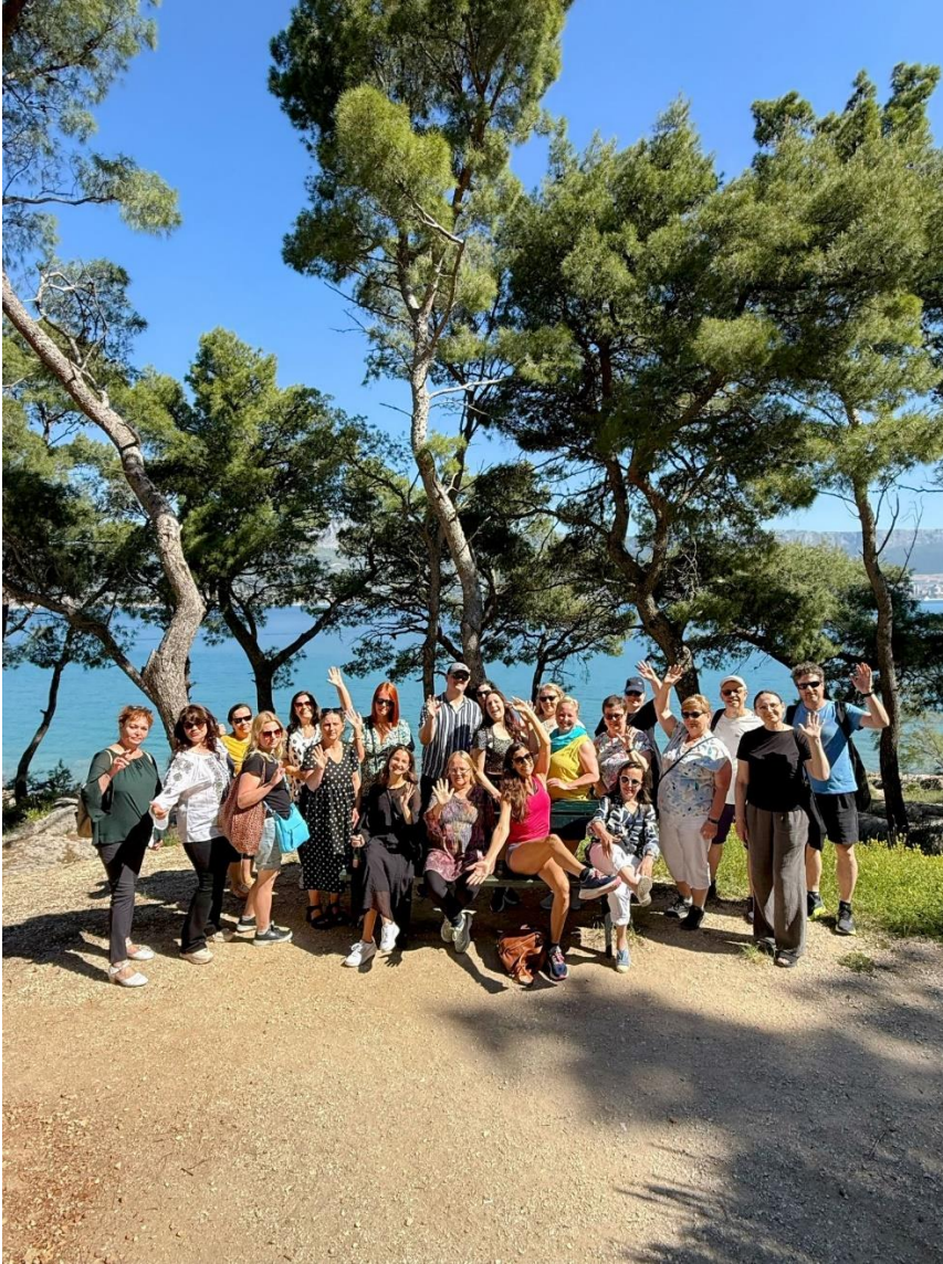
Kuva 1: Ryhmäkuva ulkona oppimisen ja mindfulness -kurssilaisten kanssa.