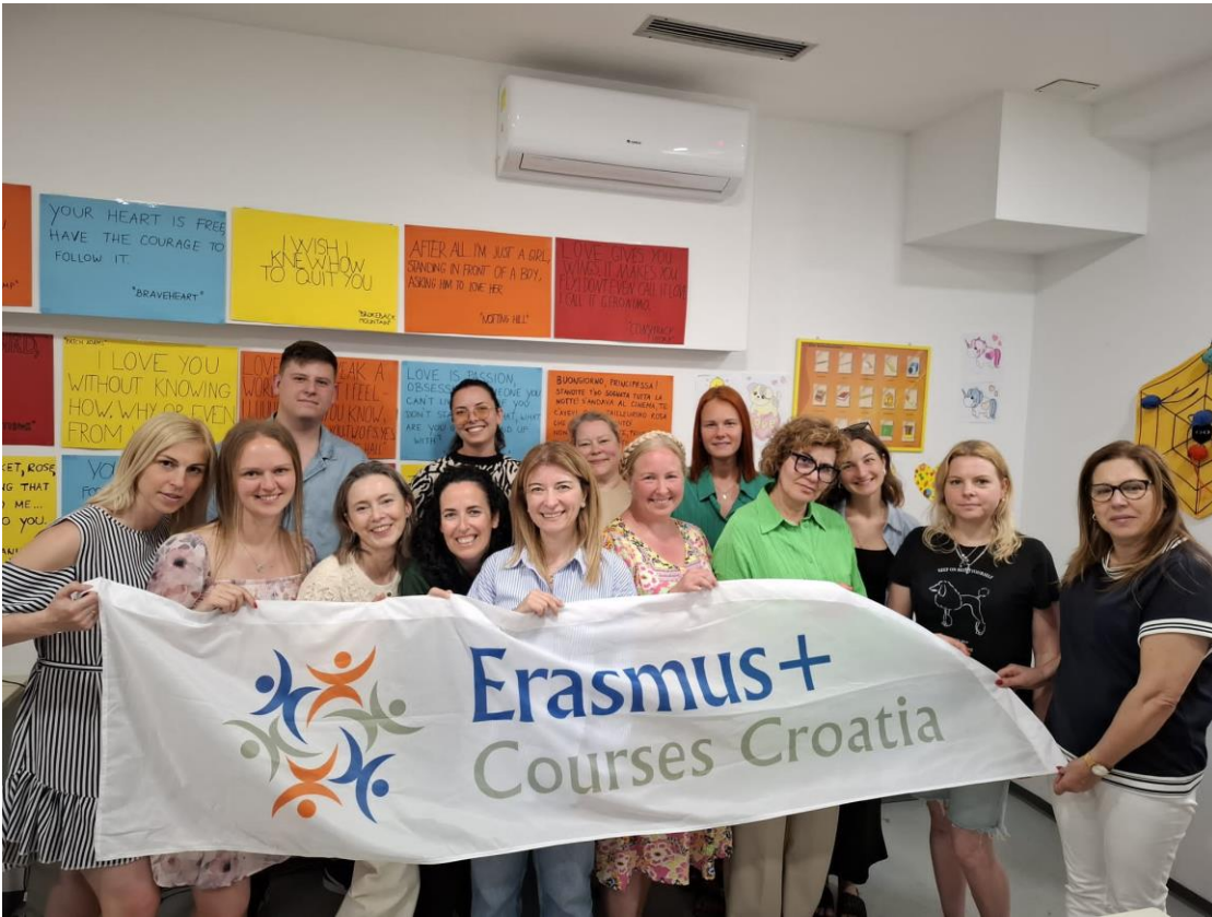
Kuva 5: Ryhmäkuva omien esitysten jälkeen