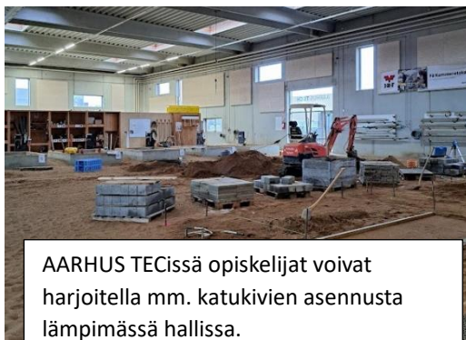
AARHUS TECissä opiskelijat voivat harjoitella mm. katukivien asennusta lämpimässä hallissa.

Iltapäivällä vierailimme AARHUS TECHissä, jossa kuulimme heidän työstään keskeyttämisen ehkäisyyn eteen sekä heidän tavastaan toteuttaa opinto-ohjausta. Valtakunnallisesti keskeyttämisprosentti ammatillisessa koulutuksessa on Tanskassa suuri, mutta Aarhus Techissä on onnistuttu viime vuosien aikana puolittamaan keskeyttämisluku. Heillä on toteutettu oppilaitoksen toiminnassa näkökulman muutos, joka on tuottanut hyvää tulosta. Heillä on ensisijaisena tavoitteena hyvinvoiva opiskelija, ja tämä varmistaa hyvin etenevät opinnot. Opinto-ohjauksella tuetaan myös henkilökuntaa ja autetaan heitä ymmärtämään opiskelijoiden