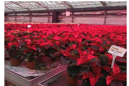
Jordbrugets Uddannelses Centerin kasvihuoneissa opiskelijat opiskelevat kasvattamaan mm. joulutähtiä

Ensimmäisenä päivänä vierailimme Jordbrugets Uddannelses Center Århusissa. Oppilaitos on meidän yhteistyökumppanimme, opiskelijoitamme oli siellä viimeksi pari viikkoa sitten. Saimme kiitosta heidän toiminnastaan ja aktiivisuudestaan vaihtojakson aikana. Keskustelimme myös oppilaitoksen useista Erasmus+ -mahdollisuuksista, jotka tarjoavat opettajille ja opiskelijoille kansainvälisiä kokemuksia. Tanskassa ammatillinen koulutus ei ole perusopetuksen jälkeen läheskään yhtä suosittu vaihtoehto, kuin lukio. Vaikka jatko-opintomahdollisuuksia myös ammatillisesta koulutuksesta on parannettu, muuttuvat mielipiteet hitaasti. Oppilaitoksella oli hankeidea, joka keskittyy hakeutumisvaiheen ohjaukseen ja opintoihin kiinnittymiseen. Tähän hankkeeseen he olivat hakemassa kumppaneita Euroopasta.