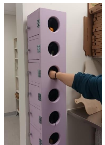
Nuorten ohjauskeskuksessa pääsi tutustumaan ammatteihin mm. tunnustelemalla erilaisia ammatteihin liittyviä esineitä.

Toisena päivänä vierailimme nuorten ohjauskeskuksessa Allèskolenissa, EUDEXOssa ja Ungdommens Uddannelsesvejledningissä. Saimme hyvän yleiskuvan ohjauksen kokonaisuudesta, jota toteutetaan kaikille avoimissa ohjauskeskuksissa. Tanskassa peruskoulujen opinto-ohjaajat työskentelevät nuorten ohjauskeskuksessa, eivät kouluilla. Opinto-ohjaajat käyvät ohjauskeskuksesta toteuttamassa ohjausta eri oppilaitoksissa. Meille esiteltiin uraohjauksen toiminnallista tutustumispistettä, jossa